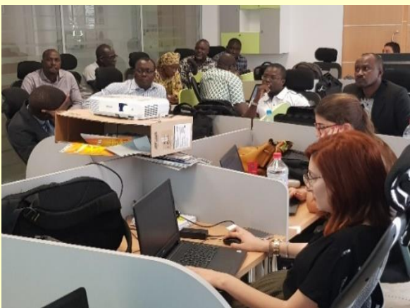
Vue d'un atelier de cadrage sur le crédit à Tunis

Entre autres activités, j'ai participé à la quasi-totalité des ateliers de cadrage fonctionnel et de reprise, et fourni le cahier de paramétrage des Tiers/Comptes et les différents modes de tarification des établissements de la CIF. J'ai aussi participé à la révision des dossiers de cadrage livrés par SAB, en collaboration avec l'AMOA et les autres membres du projet côté CIF ».