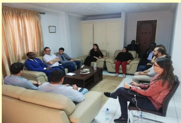
Vue d'une séance de travail de l'équipe de pilotage du projet SIG de la CIF à Ouagadougou

En perspective, nous ne pouvons qu'être rassurés sur la suite du projet et sur la capacité des équipes de la CIF à prendre la relève rapidement des équipes externes (AMOA et SAB), dès l'année 2020.