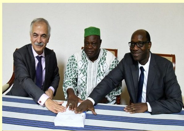
De gauche à droite, le PDG de SAB-AT, le PCA et DG de la CIF DG à la cérémonie de signature du contrat avec SAB pour la fourniture de l'ERP le 05 mars 2018 à Ouagadougou

L'attente de la CIF est un apport méthodologique pour le pilotage d'un projet d'une telle envergure (4 000 utilisateurs au niveau de 800 sites déployés et implantés dans 5 pays de l'Afrique de l'Ouest) ainsi que la définition des jalons structurants : depuis la phase de cadrage jusqu'à la phase de bascule réelle en passant par la conception détaillée de la solution cible, sa mise en œuvre, les travaux de recette, la migration des données existantes de l'ancien Système d'Information SAF, l'homologation avec les données chargées dans la solution cible et les tests de bascule à blanc.